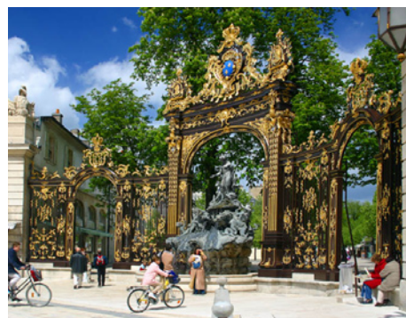
Nancy, un grand pôle séduisant et attractif

Rejoignez-nous autour du concept « COLLECTER, INVESTIR et GÉRER au cœur des territoires ».